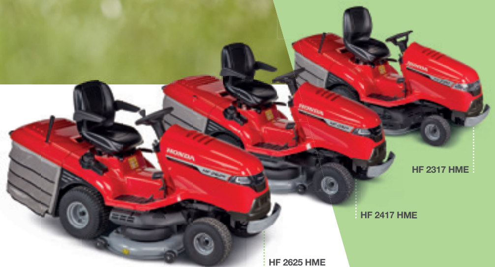
HF 2317 HME