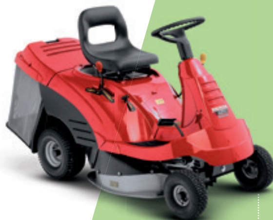
HF 1211 HE

De zitmaaier wordt aangedreven door onze Pro Spec-motor met gietijzeren cilinderhuls en krukaslager voor een soepele loop en een langere levensduur van de motor. Gemakkelijk te bedienen met één pedaal dat de hydrostatische voorwaartse snelheid regelt en ook zeer wendbaar, met een kleine draaicirkel en een uitstekend zicht. Om obstakels heen maaien was nog nooit zo eenvoudig! Met één makkelijk bereikbare hendel leegt u vanaf de comfortabele bestuurdersstoel de grasopvangbox. Zo bespaart u tijd en moeite tijdens het werk.