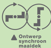
▲ Ontwerp synchroon maaidek